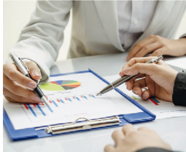
PAR MARTIN DE KERIMEL

Une certaine liberté de choix. La taxe d'apprentissage n'est pas tout à fait un impôt comme les autres. L'entreprise contribuable est libre d'affecter elle-même une partie de la somme dont elle est redevable. La dernière réforme n'est pas revenue sur ce principe.